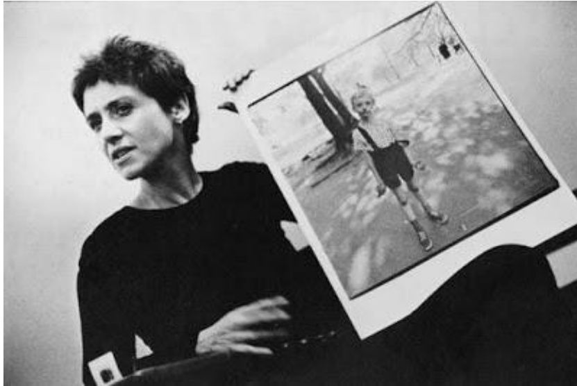
Diane Arbus (American, 1923–1971)

1923 doğumlu Diane Arbus 20. yüzyılın en önemli fotoğraf sanatçılarından biridir. Babası dönemin varlıklı işadamları arasında yer alır. Son derece geleneksel ve baskıcı bir aile ortamında yetişen Arbus, 1941 yılında eğitimini yarıda bırakarak babasının kürk mağazasında çalışan Allan Arbus'la evlenir. Allan Arbus savaş yıllarında orduda aldığı fotoğraf eğitimini eşine aktarır. Çift birlikte moda fotoğrafı stüdyosu açar. İki çocukları olur. Arbus, 1957'ye dek eşiyle birlikte moda fotoğrafçılığını sürdürür, 1958 yılında portre fotoğrafçısı olarak toplumun sınırında alışmadık hayatlar yaşayan insanların fotoğraflarını çekmeye başlar. 1960'ta Esquire dergisinde ilk foto-makalesi yayınlanır. 1963 ve 1966'ta iki kez Guggenheim ödülünü alır. 1971 yılında intihar eder. Ölümünden bir yıl sonra on fotoğrafı büyütülerek Venedik Bienali'nde sergilenir. Arbus'un eserleri Metropolitan Müzesi, Victoria & Albert Müzesi gibi müzelerde sergilenmektedir. En ünlü eserleri arasında “Yahudi bir dev, tıpatıp ikizler ve oyuncak el bombası taşıyan çocuk” yer almaktadır.