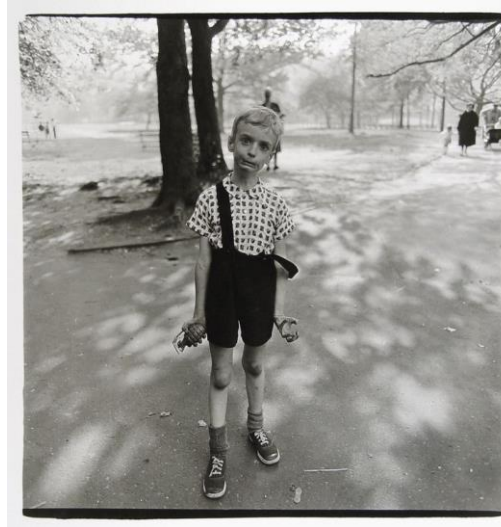
Fotođraf 10: Child with a toy hand grenade in Central Park, N.Y.C, 1962

Diane Arbus, “Yahudi bir dev” adlı fotođrafında da diđer pek çok eserinde olduđu gibi toplumsal olanın önündeki perdeyi kaldırarak, gerçeğin sonsuz varyasyonla etkileşerek oluşturduđu “sonsuz oluş biçimlerine” tanıklık etmemize aracı olmaktadır.