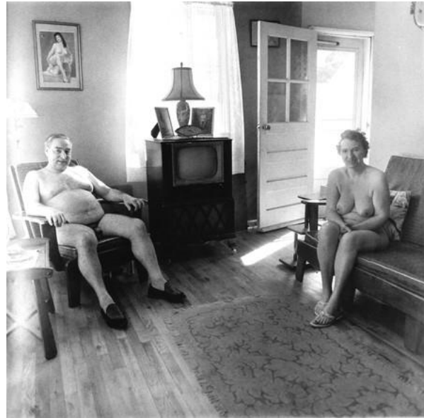
Fotoğraf 3: Retired man and his wife at home in a nudist camp one morning, N.J, 1963

Fotoğraf 2'ye bakıldığında ise, fotoğrafa adını da veren “üç adet sirk balerini” görülmektedir. Balerin dendiğinde, zihinlerde canlanan ilk imge, balerin kelimesi ile ilişkili olarak en yaygın görüntünün imgesi olacaktır. Bu da yaklaşık bir ifadeyle, kuğu benzeri, zarif, ince, uzun bir kadını çağrıştırır. Çünkü günlük yaşamda balerin olmaya dair beklentiler bunlardır ve dolayısıyla görüp görebileceğimiz balerinler, genellikle bu özelliklere sahiptir. Ancak yukarıdaki fotoğrafta durum pek öyle görünmemektedir. Arbus bu fotoğraf aracılığıyla, bir meslek ya da bir aktivite olarak da bazı kavramların, zihinlerimizde yer kaplayan imgelerden çok daha çeşitli olabileceğini göstermektedir. Tam da bu nedenle Arbus'un, mesleki anlamda dahi, tanımlı kategorileri karikatürize ettiğini ve bu yolla tanımsız oluş biçimlerine tanınırlık kazandırdığını söylemek mümkündür.