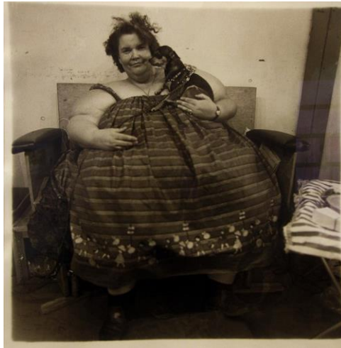
Fotoğraf 16: Circus fat lady with her dog, Troubles, 1964, Printed 1970

Normatif kurgunun dışında kalması nedeniyle toplumsal yapının dışına itilen kimseler, tam da bu özgün varoluşları dolayısıyla "engelli" olarak nitelendirilmektedir. Engel, bedeninin idealize edilmesi dolayısıyla oluşan sınırlardır. Sınırların dışında kalanlar, normatif toplum kurgusu tarafından engelli olarak nitelendirilmektedir. İdeal-bedenlilik anlayışı, toplumun her bir yapısını, söz konusu idealler çerçevesinde inşa etmektedir. Bu durum, engelli olarak nitelenen kimselerin, sosyo-kültürel alanda varlık gösterememesine sebep olmaktadır. Örnek olarak, 1970 ya da 71 tarihli olduğu düşünülen Arbus'un bu isimsiz fotoğrafında iki adet down sendromlu kadın görülmektedir. Toplumsal kurgunun engelleyici yapılandırmalarının aksine, kendileriyle barışık ve neşeli görünen kadınlar, Arbus'un objektifi aracılığıyla, en doğal halleriyle görüş açımıza dahil edilmişlerdir.