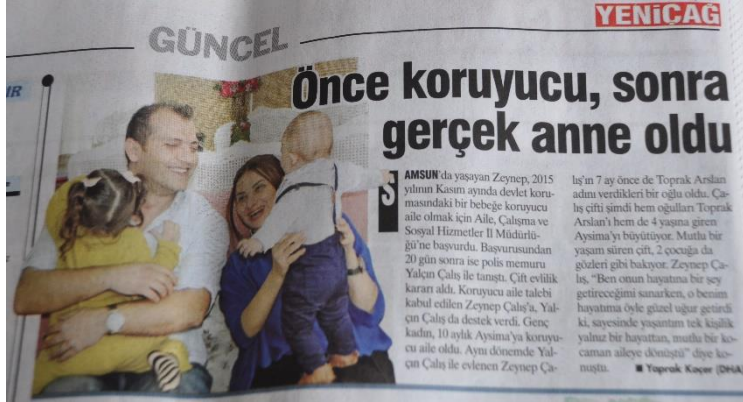
Resim 8 – 8 Şubat 2019 tarihli Yeniçağ haberi

8 Şubat tarihinde Yeniçağ gazetesinde dördüncü sayfadan verilen haber “Önce Koruyucu, Sonra Gerçek Anne Oldu” başlığıyla sayfanın üst kısmında verilmiştir. Haberde ailenin fotoğrafları, çocukların yüzü gizlenmiş olarak sunulmuştur.