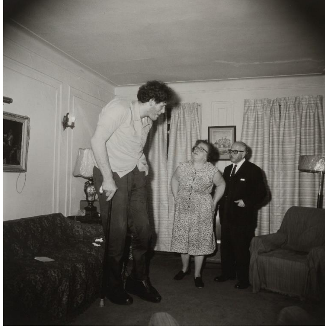
Fotođraf 9: A Jewish giant at home with his parents in the Bronx, NY, 1970

Diane Arbus, “Yahudi bir dev” adlı fotođrafında da diđer pek çok eserinde olduđu gibi toplumsal olanın önündeki perdeyi kaldırarak, gerçeğin sonsuz varyasyonla etkileşerek oluşturduđu “sonsuz oluş biçimlerine” tanıklık etmemize aracı olmaktadır.