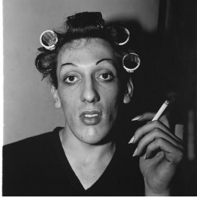
Fotoğraf 5: A Young Man in Curlers at Home on West 20th Street, NYC, 1966.

Arbus, fotoğraf 5'te de görülebileceği gibi, toplumun normatif adlediği kimseler tarafından “freak” (ucube) olarak görülen bu kişilerin, tüm etiketlerin ardındaki görüntüsünü objektifinden yansıtmış ve “freak photographer” (ucube fotoğrafçısı) olarak ünlenmiştir. Arbus, yaşamı boyunca tuhaf insanları aramasının sebebini “diğer insanlar tarafından dışsal olarak normal görünmesine karşın kendisini içsel olarak hep tuhaf, değişik hissetmesi” şeklinde ifade etmektedir (Bosworth, 2018). Öteki diye tabir edilen kimselerin özünde barındırdığı maskesiz, gizli yüzü ortaya çıkarma isteği, Arbus'un motivasyonu olmuştur. Arbus'un fotoğraflarında yer alan insanlar, poz vermekten ziyade adeta vizörden bakan göz ile gizli bir işbirliği ya da ortak bir anlayış geliştirmiş gibidirler.