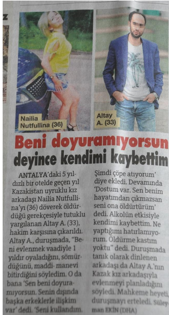
Resim 7 – 8 Şubat 2019 tarihli Sözcü haberi

Sözcü gazetesinde 8 Şubat tarihinde “Beni Doyuramıyorsun Deyince Kendimi Kaybettim” başlığıyla yer alan haber, üçüncü sayfanın altında verilmiştir. Resim 7’de görüldüğü üzere, olayın aktörlerinin fotoğrafları haber metninin üzerinde yer almaktadır. Maktul kadının mini etekli bir pozu kullanılırken adı ve yaşı da açıkça belirtilmiştir. Öte yandan katil erkeğin normal giyimli bir pozu, yüzü buzlanarak ve soyadı gizlenerek verilmiştir.