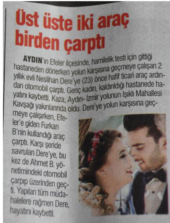
Resim 4 – 2 Şubat 2019 tarihli Yeniçağ haberi

2 Şubat tarihinde yayımlanan haber hem Yeniçağ hem de Sözcü gazetelerinde üçüncü sayfada yer bulmuştur. Yeniçağ gazetesi haberi “Üst Üste İki Araç Çarptı” başlığıyla sayfanın ortasında, Sözcü gazetesi ise “Hamilelik Testinden Dönerken Kazada Öldü” başlığıyla yine sayfanın orta kısmında vermiştir.