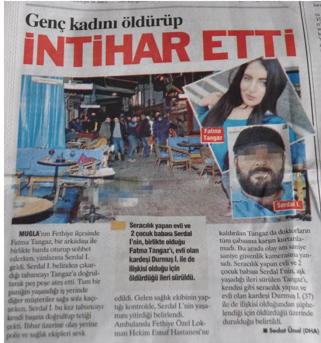
Resim 3 – 1 Şubat 2019 tarihli Yeniçağ haberi

Sözcü gazetesinde ise aynı haber 3. sayfanın başında ve “Kıskançlık Cinayeti” başlığı ile hem maktul ve katilin hem de olay yerinin fotoğraflarıyla verilmiştir. Maktul kadının fotoğrafı, erkeğine oranla daha büyük olarak basılmıştır. Yine maktul kadının adı ve soyadı açıkça verilirken katil erkeğin soyadı gizlenmiştir.