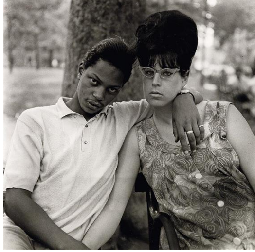
Fotoğraf 19: A Young Man and His Pregnant Wife in Washington Square Park, 1965

Diane Arbus'un 1970 ya da 71 yıllarında çekildiği düşünülen isimsiz bir diğer fotoğrafta, iki adet gülümseyen kadın yer almaktadır. Kadınlar öyle içten ve coşkuyula gülümsemektedirler ki, objektiften izlerkitleye tesir eden duygu, kadınların o esnada yaşadığı düşünülen duygunun ta kendisidir: Yakınlık ve neşe. Bu yönüyle fotoğrafın, fiziksel görünüşe dair önyargıları son derece geçersiz kıldığını söylemek mümkündür.