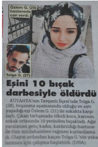
Resim 6 – 5 Şubat 2019 tarihli Sözcü haberi

Sözcü gazetesinde üçüncü sayfada yer alan haberde bir kadın cinayetine yer verilmiştir. Resim 6’da görüldüğü üzere “Eşini 10 Bıçak Darbesiyle Öldürdü” başlığıyla verilen haber, üçüncü sayfanın sağ üst köşesinde bulunmaktadır.