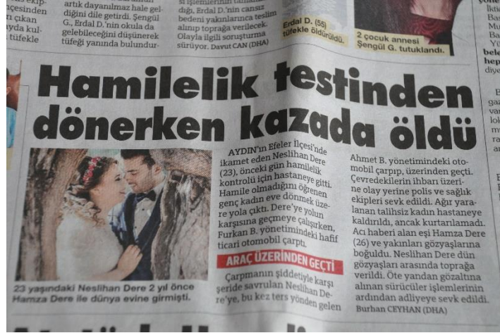
Resim 5 – 2 Şubat 2019 tarihli Sözcü haberi

Sözcü gazetesinde yayımlanan haberde de kadının düğün fotoğrafı kullanılmış, fotoğraf altında da kadının ve eşinin yaşı ile iki yıl önce evlendikleri belirtilmiştir. Resim 5’te verilen haber metninde aktör kadın için “genç” ve “talihsiz” sıfatları kullanılmış, kadının gözyaşları içinde toprağa verildiği belirtilmiştir.