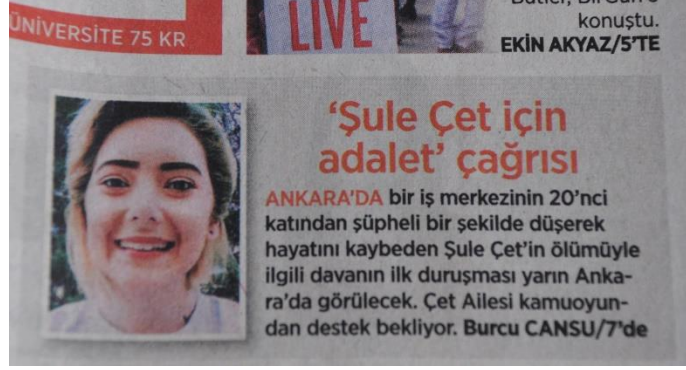
Resim 11 – 5 Şubat 2019 tarihli BirGün haberi