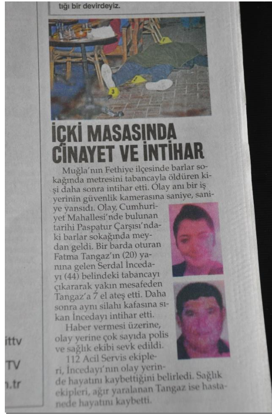
Resim 1 – 1 Şubat 2019 tarihli Akit haberi

İlgili tarihten önceki gün meydana gelen adli vaka, üç gazetede yer almaktadır. Bir kadın cinayetinin ve intiharın yaşandığı olay; Akit gazetesinde üçüncü sayfanın sağ alt köşesinde “İçki Masasında Cinayet ve İntihar” başlığıyla, Sözcü gazetesinde üçüncü sayfanın başında “Kıskançlık Cinayeti” ve Yeniçağ gazetesinde üçüncü sayfanın altında “Genç Kadını Öldürüp İntihar Etti” başlıklarıyla yayımlanmıştır.