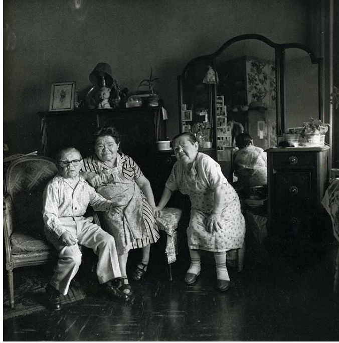
Fotoğraf 4: Russian midget friends in a living room on 100th St, N.Y.C., 1963, 1963

Fotoğraf 3, Arbus tarafından 1963 yılında, çıplaklar kampında çekilmiştir. Çıplaklar kampında bir çiftin, tabiatı gereği tamamıyla çıplak bir biçimde objektife gülümseyerek poz verebilmesi oldukça önemlidir. Zira o ortama özgü bir mahremiyet söz konusuyken, böyle bir karenin yakalanabilmesi için, kuşkusuz fotoğrafçının da onlardan biri olması gerekmektedir. Yukarıdaki karede de görülebileceği üzere, Arbus'un, fotoğrafını çektiği kimselerin yaşamlarına dahil olmak konusunda başarılı olduğunu söylemek mümkündür. Bu başarı, Arbus'un alışılmışın dışında yaşamları fotoğrafladığı düşünüldüğünde, daha fazla önem kazanmaktadır.