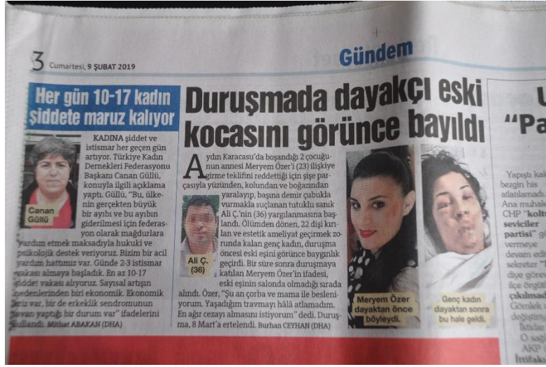
Resim 10 – 9 Şubat 2019 tarihli Sözcü haberi

Sözcü gazetesinde “Duruşmada Dayakçı Eski Kocasını Görünce Bayıldı” başlığıyla üçüncü sayfanın başında verilen haberde, boşandığı eski eşine şiddet uygulayan erkeğe açılan davanın duruşması konu edilmektedir. Sanık erkeğin soyadı gizlenip basılı fotoğrafında yüzü buzlanırken mağdur kadının hem şiddet gördüğü halinin fotoğrafı hem de güncel fotoğrafı erkeğin fotoğrafına oranla daha büyük basılmış, adı soyadı da açık açık yazılmıştır.