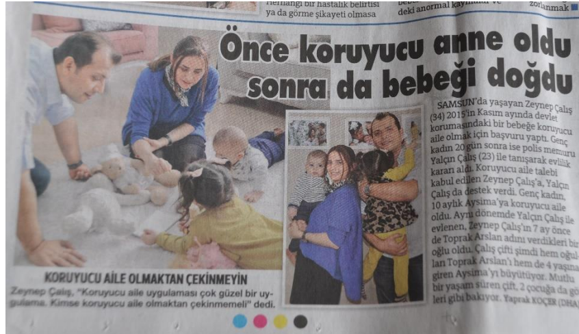
Resim 9 – 8 Şubat 2019 tarihli Sözcü haberi

8 Şubat tarihinde Yeniçağ gazetesinde dördüncü sayfadan verilen haber “Önce Koruyucu, Sonra Gerçek Anne Oldu” başlığıyla sayfanın üst kısmında verilmiştir. Haberde ailenin fotoğrafları, çocukların yüzü gizlenmiş olarak sunulmuştur.